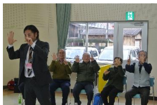
公民館サークル「笑待夢」に 協力いただきました！

去る1月16日(木)、社会教育講座「笑って 笑って 90分～笑いで脳を活性化しましょう！」を開催しました。30名に参加いただき、楽しいお話を聞いたり両手を別々に動かす運動などをし、90分を笑ってすごしました。