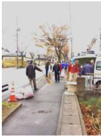
過去の活動の様子

毎年恒例となっているケヤキ並木の清掃活動が、今年も始まりました。十一月中の毎週日曜日、午前八時より行います。 地域の皆さま、ご協力のほど、よろしくお願いいたします。