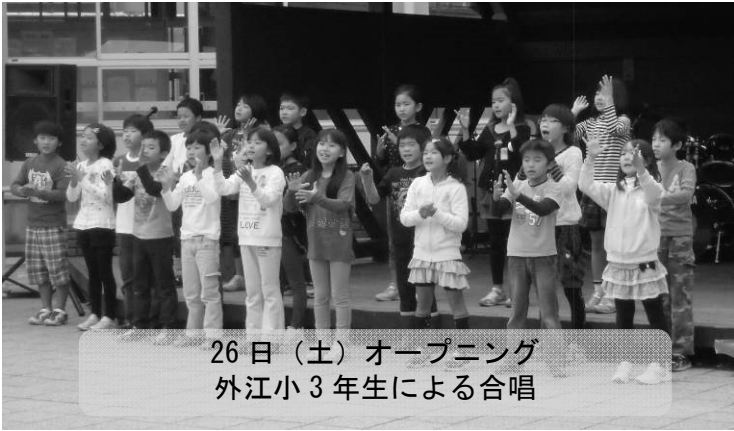
26日(土) オープニング 外江小3年生による合唱