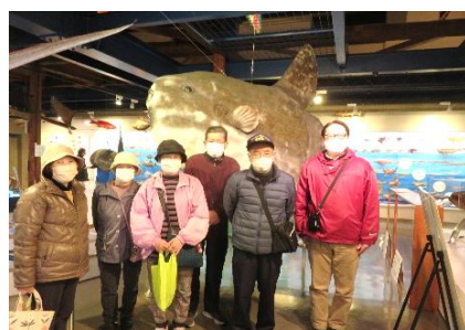
大池館長の説明はとても面白い