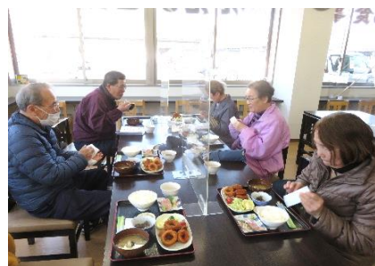
さかな塾でランチ♪