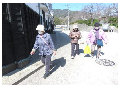
晴天に感謝しながら、お散歩