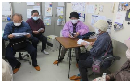
レジュメを見ながらバスの乗り方を学ぶ

令和5年3月3日（金）公民館主事が添乗し、5名の方が、はまる一ぷバスの乗り方を学びながら、水産物直売センター、おさかなパーク、海とくらしの史料館へ見学に行きました。