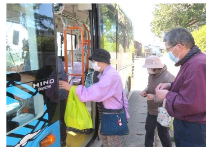
「さあ復習よ！前払いよね」