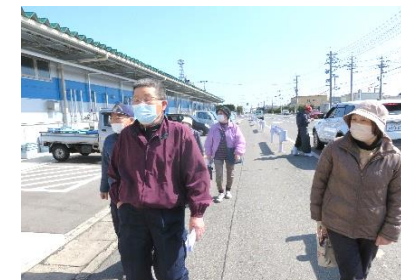
水産物直売センター到着！