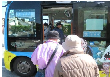
さあ、いよいよ乗車