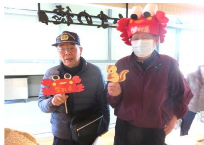
直売センターでお買い物