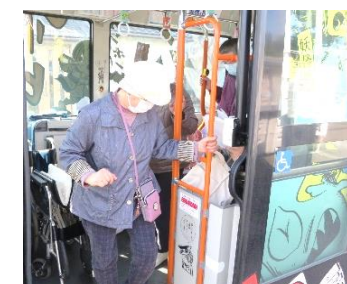
無事到着「乗車の自信がついたわ！」