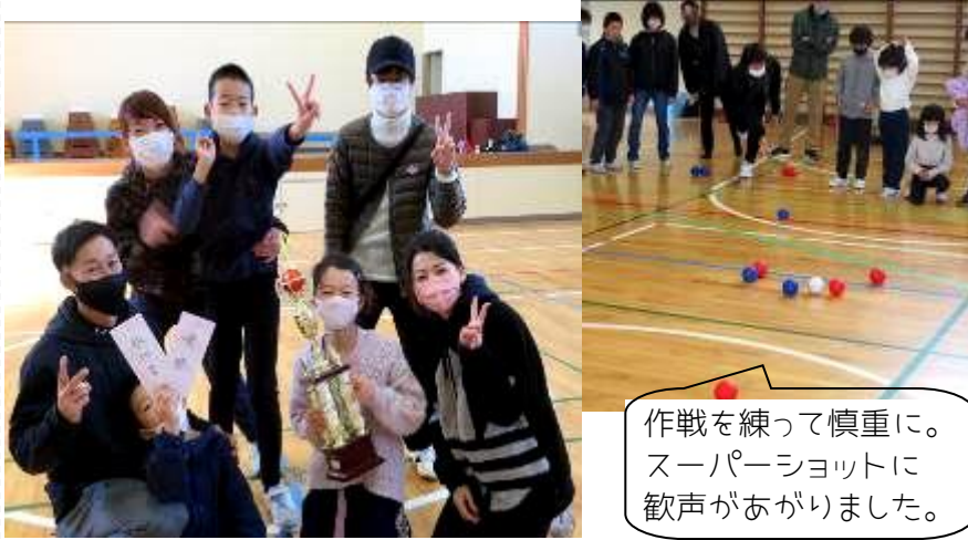
作戦を練って慎重に。スーパーショットに歓声があがりました。

11月28日に上道小学校の体育館で、上道校区体育会主催の「ポッチャ大会」が開催されました。大人も子どもも、一緒に楽しみました。久しぶりに、笑顔があるれる体育館でした。優勝は5区、準優勝は6区、3位は2区でした。